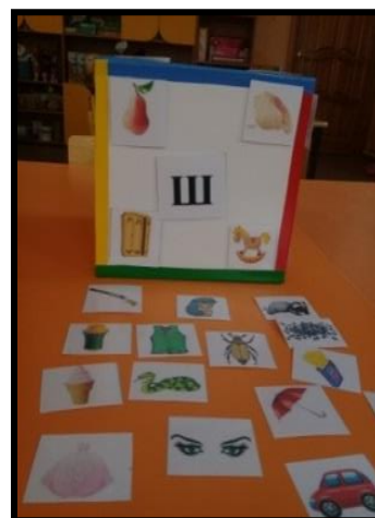
Д/И «Назови предметы, с данным звуком»