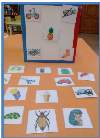
Д/И «Назови, что ты видишь»

Дидактическое пособие можно предложить родителям для индивидуальной работы с детьми дома.