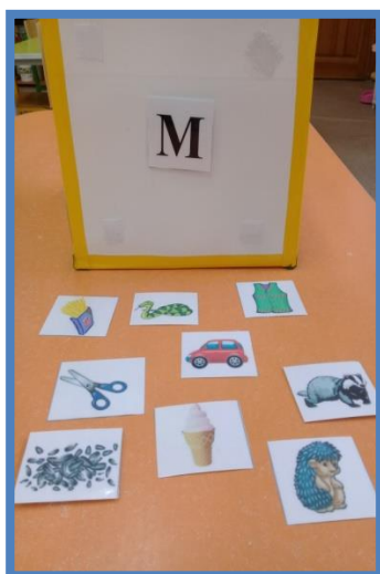
Д/И «Подбери картинки с заданным звуком»